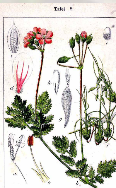
Gemeiner Reiherschnabel, Erodium cicutarium .

Etimologia: Erodíós in greco significa "airone" ed è riferito al frutto a forma di becco (come per Geranium si sottolinea la forma dei frutti). Il nome specifico; cicutarium è un evidente riferimento a piante appartenenti alla famiglie delle ombrellifere (la cicuta), rassomiglianti nella forma delle foglie.