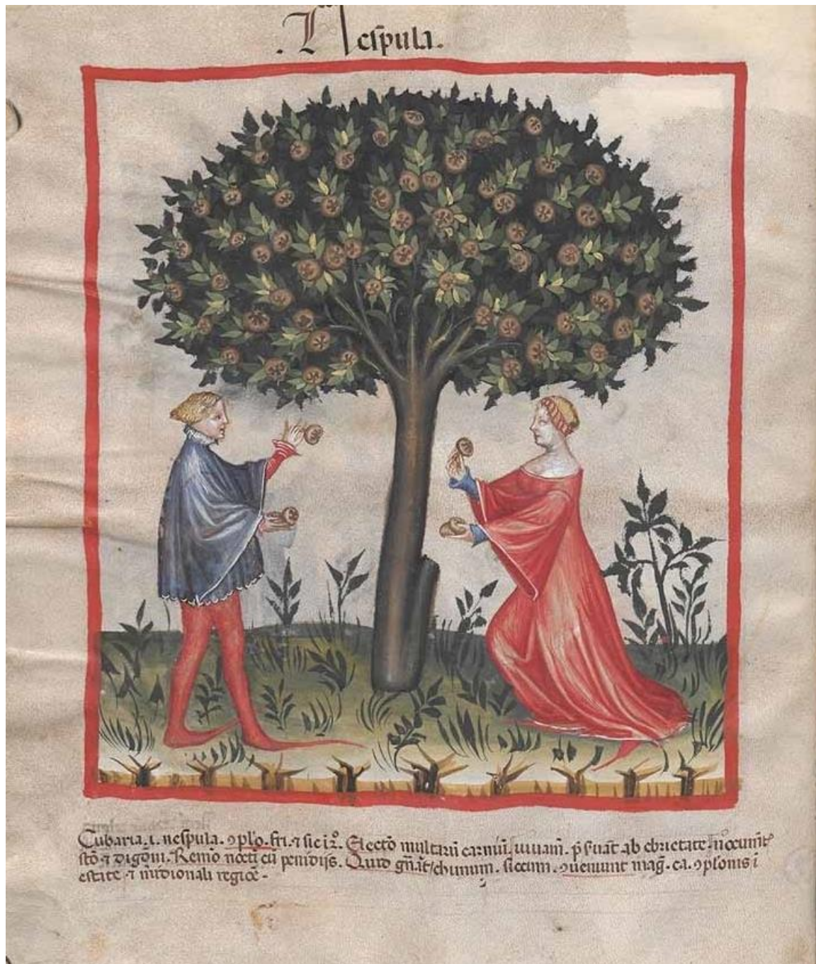
Halaf Ibn-Abbas Zahrawi, Tacuinum sanitatis, t. 10v (1380-1399)