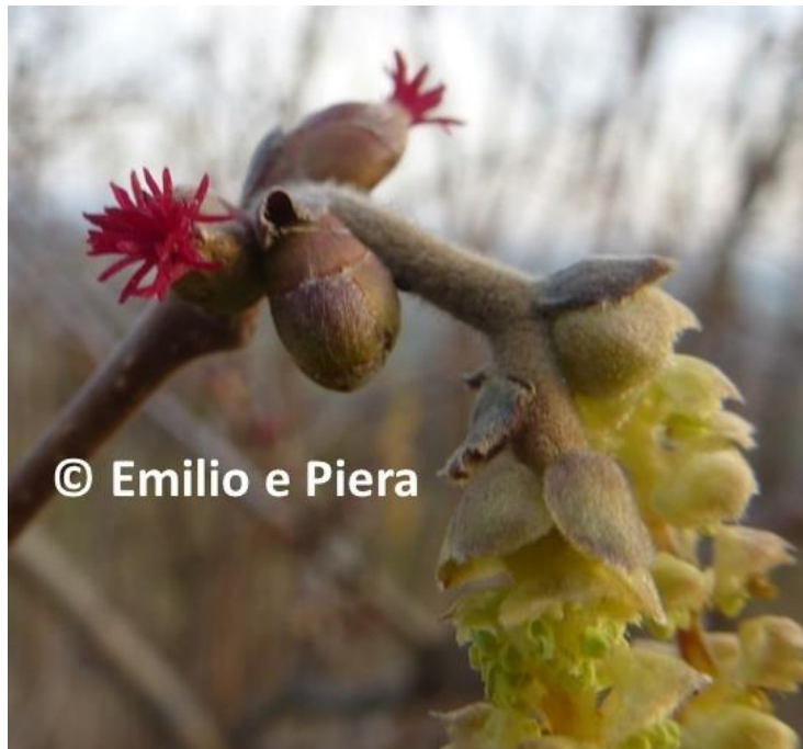
Fig. 1 Fiore femminile, stigmi