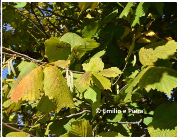
Fig. 3 Foglie e amenti