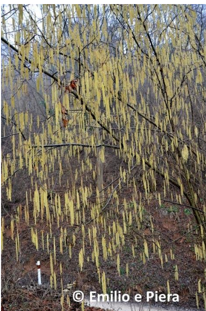
Fig. 2 Arbusto carico di amenti maturi