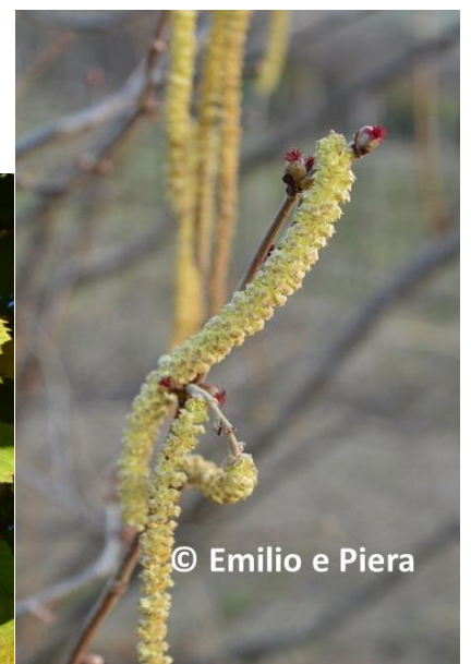
Fig. 4 Fiore maschile e fiori femminili