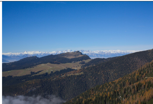
Panorama dal sentiero per cima Portule verso Spiz Vezena

Itinerario molto panoramico e suggestivo nel cuore dell'Altopiano di Asiago nella stagione dei migliori colori per i riflessi che nascono dai colori delle foglie e delle rocce calcaree chiare. Tutta l'area fu durante la grande guerra uno dei punti strategici dopo la fase di assestamento successiva alla "spedizione di primavera" (Strafexpedition), dall'estate 1916 fino al ritiro italiano dalle linee avanzate del Zebio per accorciare la linea del fronte verso il Grappa a seguito della disfatta di Caporetto. Vennero combattute le battaglie dell'insignificante altura, allora senza nome, dell'Ortigara (Giugno 1917) e del monte Zebio, con il sacrificio di circa 35.000 (trentacinquemila) giovanissimi soldati da ambo le parti.