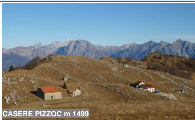
CASERE PIZZOC m 1499