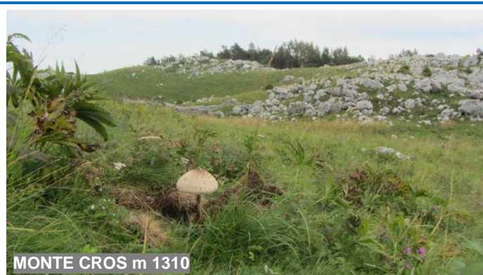
MONTE CROS m 1310