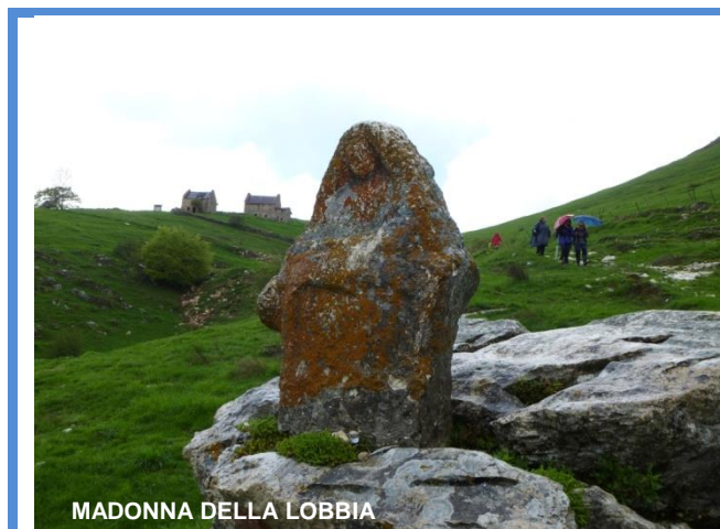
MADONNA DELLA LOBBIA

Possibilità di visitare l'interessante Museo dei fossili della Pesciara, a Bolca.