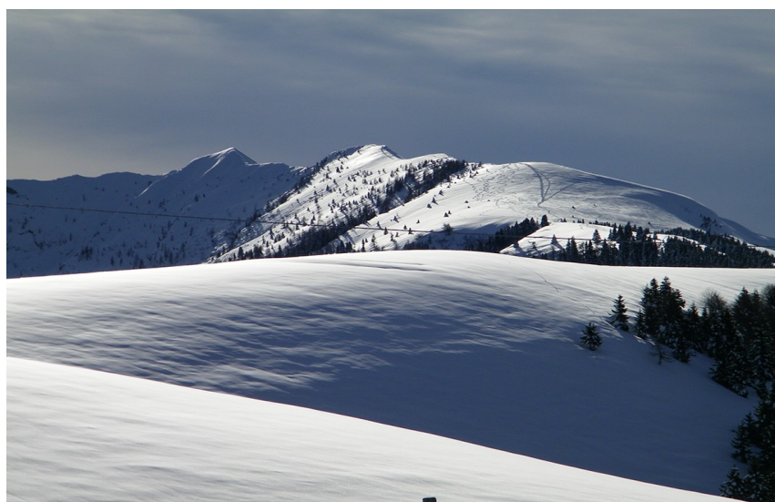
Pendii e cresta del Monte Coppolo

Dal Passo Brocon ( 1616 m.) dolcemente, per pendii innevati e poi per cresta sempre più affilata, saliremo “quasi in cima” al Monte Coppolo ( 2069m.), il cui versante sud precipita verso l'altopiano di Lamon.