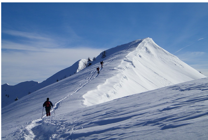
La cresta del Monte Coppolo