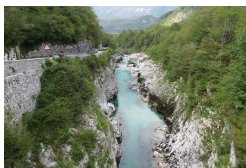
L'Isonzo dal Ponte di Napoleone