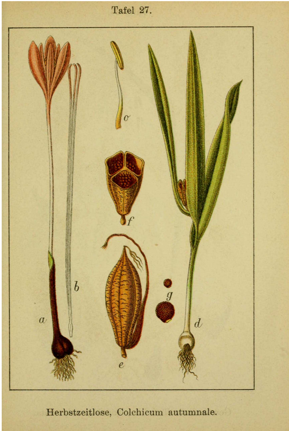
Herbstzeitlose, Colchicum autumnale .