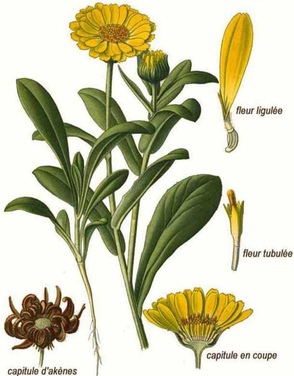
Pl. 171. Souci des champs. Calendula arvensis L.

Atlas des Plantes de France, A. Masclef 1891