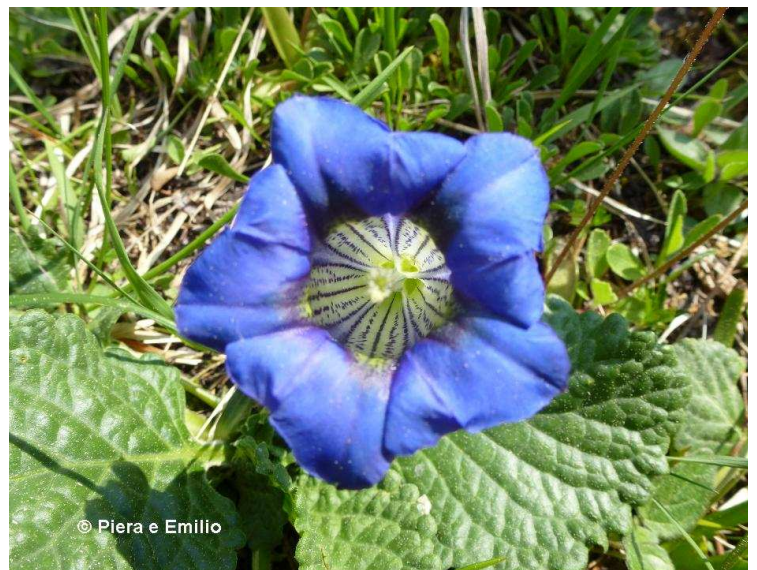
Genziana dei calcari