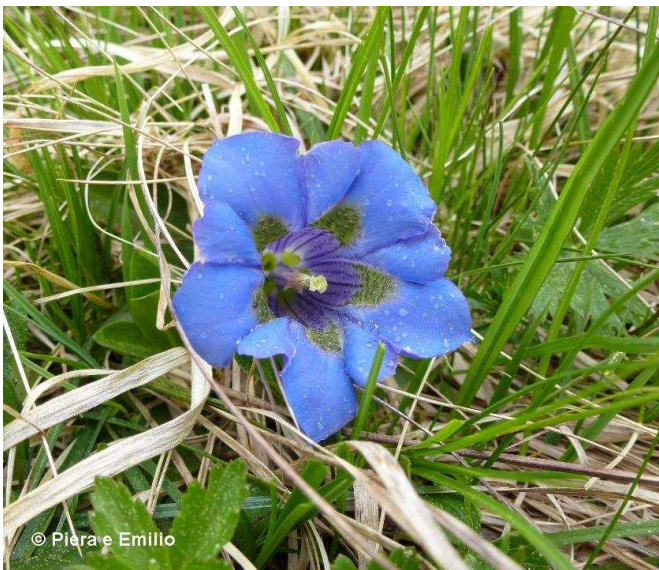
G. acaule o kochiana