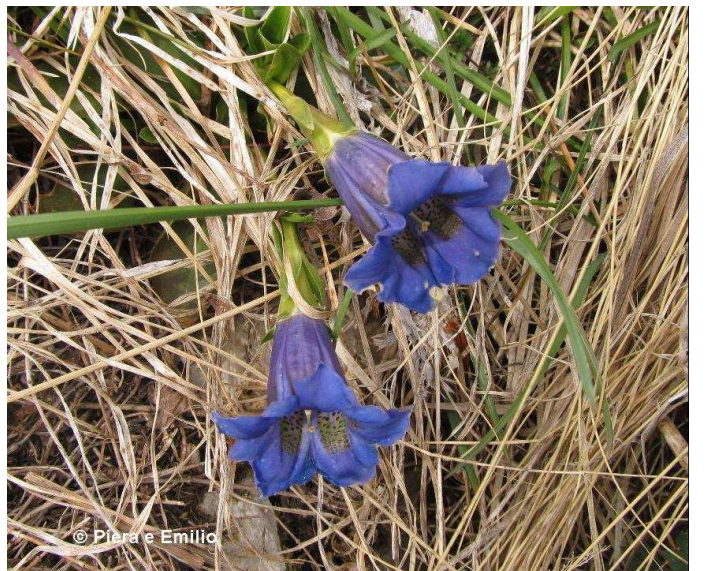
Genziana dei calcari, clusii